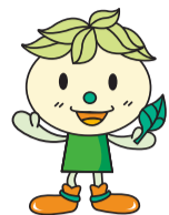
LaLaテラス南千住キャラクター ララハちゃん